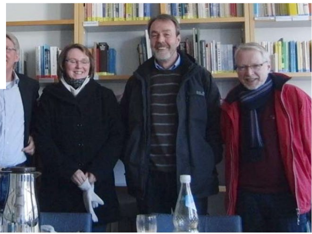
Moderation: Ursula Schmidt-Bichler (ohne Foto)