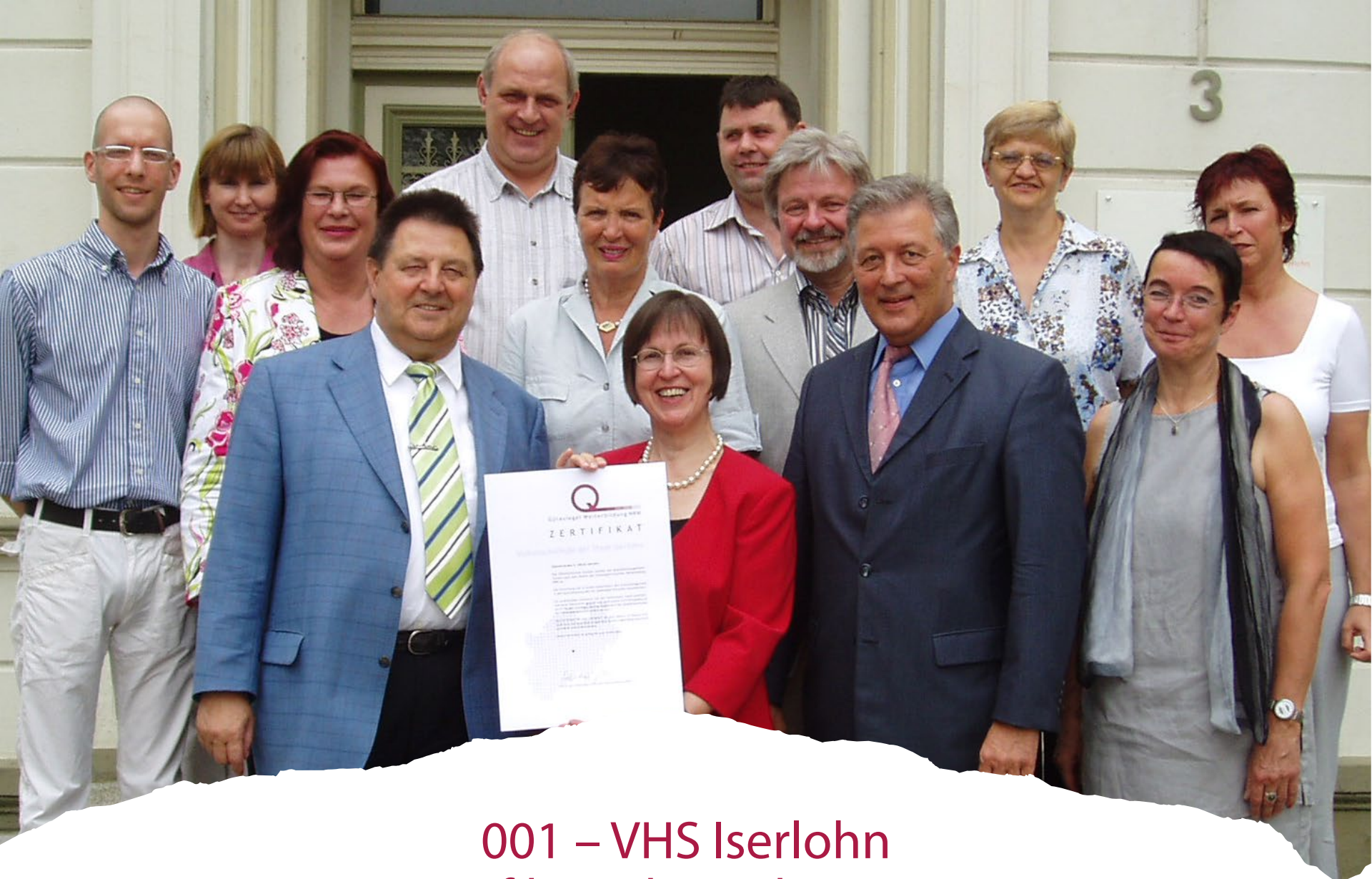
001 – VHS Iserlohn Zertifikatsübergabe - 2005