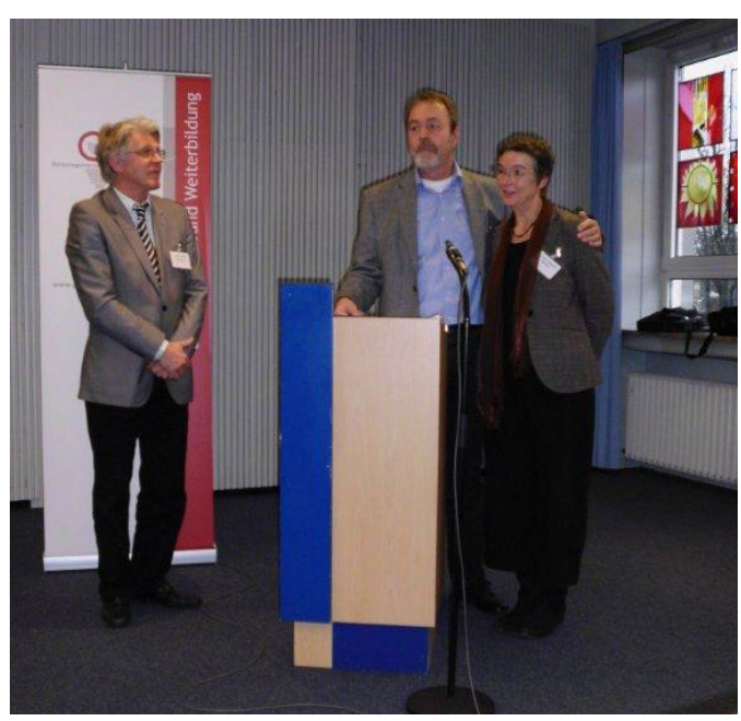
Audits am 08.03.2011